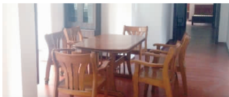
社区居家养老服务中心一角

在与记者的交谈中,韩维维陆续地接了好几个电话,全部都是向她咨询居家养老服务中心何时开业的,“这几天接的全是这种咨询电话,看来丹徒新城里确实是有不少家庭需要这个服务中心的啊。”韩维维笑着说。(记者 孙晨飞)