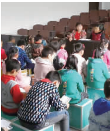
孩子们在学唱“秀山号子”