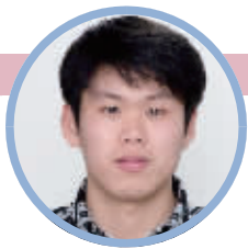
蹲点记者:孙晨飞 (民生新闻部记者)