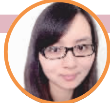
蹲点记者:施静静 (新闻策划部记者)