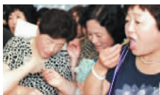
市民疯狂抢吃食补之王“海参”

目前，长寿岛海底金热销全国，很多慢性病，像心脑血管、失眠、健忘、便秘、前列腺等陈年老病，都明显改善，降压药、降糖药吃得少了，一些老年人表示，他们要坚持吃，也像长寿岛老人一样，吃出百岁奇迹！