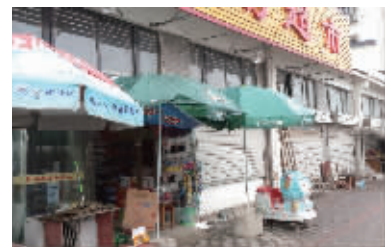
用以保值增值的门面房。

大病救助机制和考取大学本科村民奖励办法;经新型农村合作医疗报销后,村民自身承担医药费1万元以上,将享受一次性1000元救助金;村民参加高考,考取本一奖励3000元,本二奖励2000元,本三奖励1000元。这两项措施实施一年多来,官塘桥村已救助31名生病村民,奖励10名考取大学本科的村民,累计发放救助金3.1万元,奖励金1.3万元。