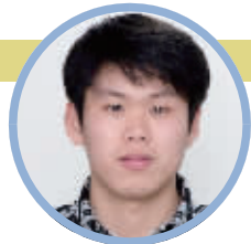
蹲点记者:孙晨飞 (民生新闻记者)

由于长时间的辛劳,凌云患上了眩晕症,平时只要过于劳累,就会头晕目眩。凌云说,这么多年来,她已经习惯了,不管怎么样,她都会尽最大的努力去做好儿媳该做的事。(记者 孙晨飞)