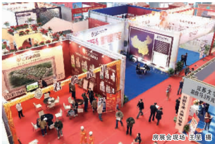
房展会现场

会场人潮涌动，来来往往的购房者络绎不绝。各家展台各具特色，尽情展现自身特色，现场花絮多多，妙趣横生。永隆城市广场、云开甲等开发商都有登记预约后迅速成交的不俗业绩。不少参展商纷纷表示，展会效果相当满意，前来看房的购房者数量远超预期，房展会将近期镇江市民的购房热情再度激发。