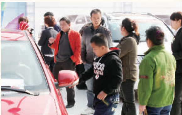
车展现场

会场人潮涌动，来来往往的购房者络绎不绝。各家展台各具特色，尽情展现自身特色，现场花絮多多，妙趣横生。永隆城市广场、云开甲等开发商都有登记预约后迅速成交的不俗业绩。不少参展商纷纷表示，展会效果相当满意，前来看房的购房者数量远超预期，房展会将近期镇江市民的购房热情再度激发。