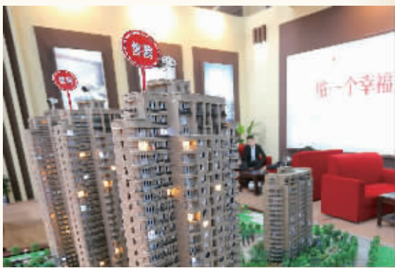
金九银十 房市火爆