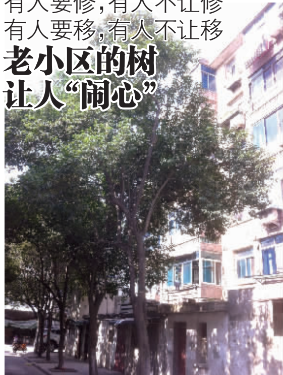
居民楼前的树

本报讯 前两天,贺家弄社区又收到了一张关于树的12345 交办单,这样的交办单,“一年总要收到过十次八次,更别提居民直接打来的电话了。”社区工作人员说。