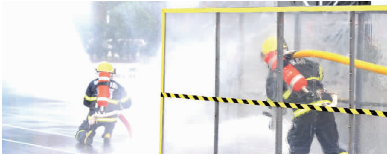
镇江消防部门不断从实战出发,设置部队训练科目,不断提高部队战斗力。