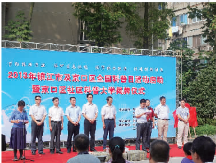
京口社区科普大学揭牌仪式