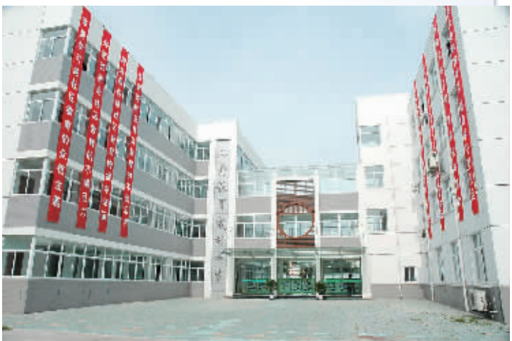
社区教育中心一隅