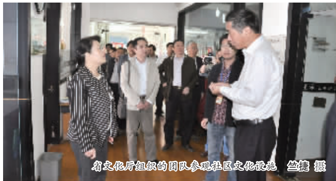
省文化厅组织的团队参观社区文化设施

今年，社区还有什么动作？据悉，这里将要打造“篆刻社区”、“诗词社区”，无疑，它们又将是社区的一张新名片。 (记者 竺捷)