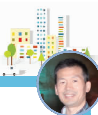
蹲点编辑： 周本林(地方新闻部编辑)

今天，是四牌楼街道规定的完成第一阶段核查的时间节点，江二社区圆满完成任务。原来6名社区干部因拆迁走掉一半，要不是12名网格长的全力加盟，这活要完成还真悬。 (竺捷)