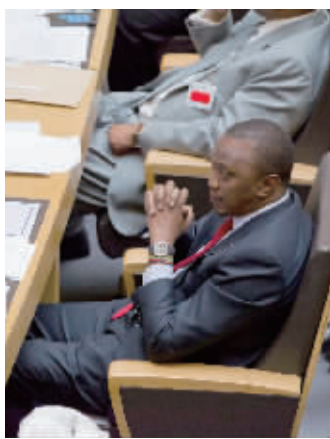
肯雅塔出席非盟特别会议。

除肯雅塔和鲁托,另一名遭国际刑事法院指控的在任非洲国家领导人是苏丹总统巴希尔。他拒绝出