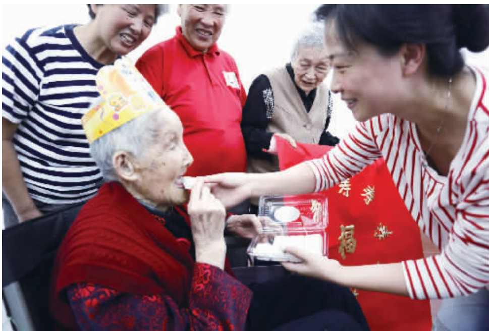
90岁老人剪纸送福为百岁老人祝寿